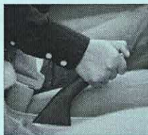
Frein à main ou frein de stationnement autorisé