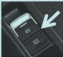
Frein de stationnement à commande électrique interdit